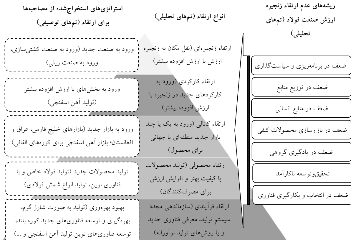
شکل ۱) تم‌های تحلیلی و دیاگرام تماتیک

در گام سوم این بخش برای اعتبارسنجی و تأیید روابط استخراج‌شده بین کارکردهای نظام نوآوری و ریشه‌های عدم ارتقاء، پرسشنامه‌ای شامل ۳۲ سنجه تدوین شد (برای هر زیرکارکرد یک سنجه). در پرسشنامه مزبور برای هر یک از ارتباطات، با لحاظ یک طیف پنج‌تایی لیکرت برای گویه‌ها از پرسش‌شوندگان خواسته شد که نظر خود را بر مبنای عددی از ۱ (خیلی کم) تا ۵ (خیلی زیاد) اعلام نمایند.