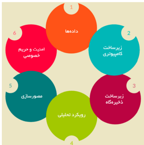
شکل ۲. طبقه‌بندی شش بعدی کلان داده‌ها [۳۳]

گروه «بررسی کلان داده»، یک طبقه‌بندی شش بعدی برای معرفی فناوری‌های «نوآوری داده»، که در شکل ۲ آمده را ارائه داده‌اند. این ابعاد از شش جنبه‌ای به وجود می‌آیند که برای ایجاد زیرساخت‌های کلان داده‌ها مورد نیازند. این شش بعد، شامل داده‌ها، زیرساخت رایانش، زیرساخت ذخیره‌گاه، رویکرد تحلیلی، مصورسازی، امنیت و حریم خصوصی می‌شود.