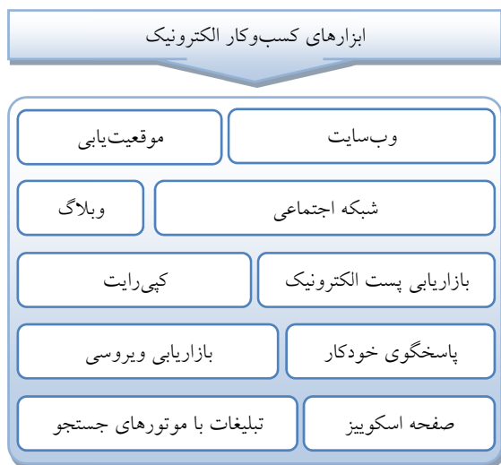
شکل ۳. ابزارهای معروف کسب و کار الکترونیک [۳۶]